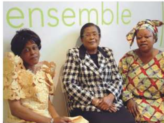
Créatrices qui ont souscrit un prêt en groupe à Aubervilliers

Au niveau national, le score des clients Adie a peu évolué entre 2006 (8.10) et 2008 (8.56) malgré une très forte croissance de l'activité. L'Adie reste donc fidèle à son public et ne dérive pas de sa mission sociale.