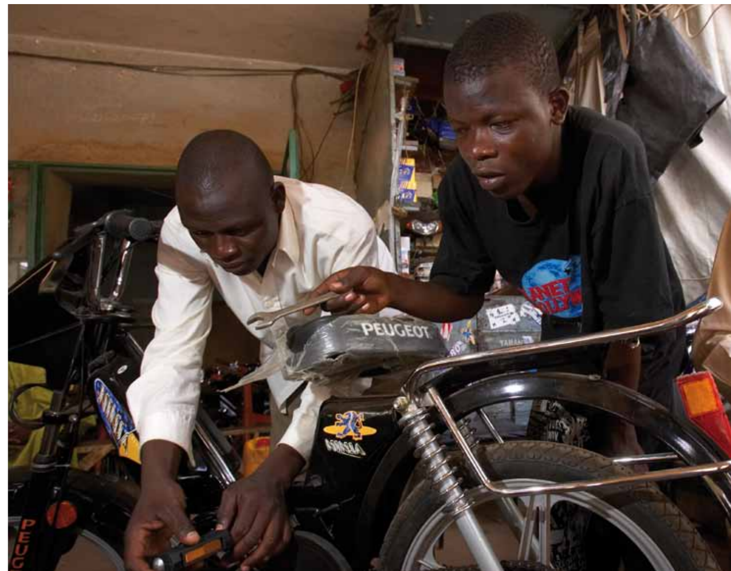
Le RCPB, sensible à la question du chômage des jeunes, expérimente le crédit aux jeunes artisans (CRED'ART), un appui financier à l'auto-emploi.

du réseau afin de marquer un « temps d'observation ». Les caisses populaires vivent une vraie crise de croissance.